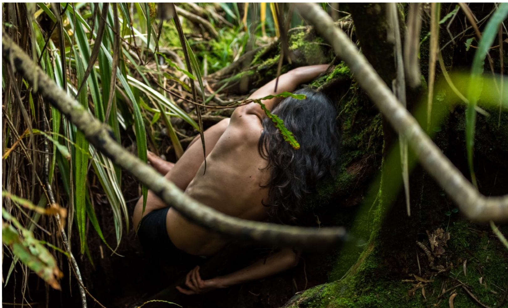
Corps et paysage, Bélouve-Forêt primaire de l'Île de la Réunion, résidence de recherche autour de Racines

Rémunération : 50 € de l'heure par artiste-pédagogue